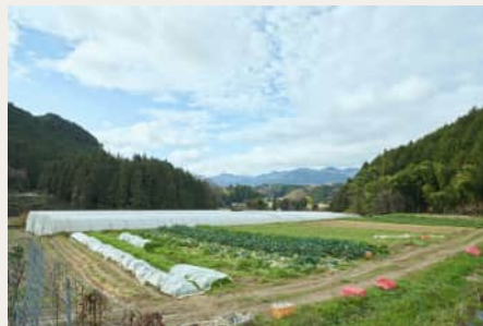
視察プログラム（施設紹介や圃場見学など）