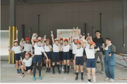
宇陀市内小学5年生 農業体験