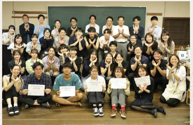
大学生ビジネスコンテスト