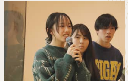
私立中高生 探究 INNOVATION CAMP