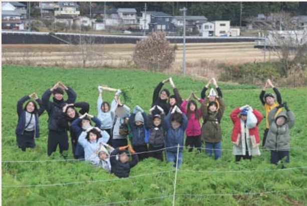
「自然学舎」 宿泊研修