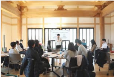
宇陀市主催 学び合いブートキャンプ