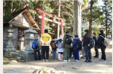
地域探究プログラム

最大70名様 of 宿泊に対応するプログラムをご用意。農体験や地域課題に触れる、本物の体験を通じた学びが、未来を生き抜く力を育みます。プログラムはご希望に応じて柔軟に企画いたします。