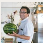
GREEN EXPO 2027テーマ館 展示プラン担当 前NHKエンタープライズ 専務取締役

プラントハンターとして世界中を巡り、その圧倒的な知識と感性を活かし、国内外で植物を用いた空間演出やランドスケープデザインを多数プロデュース。VUTAIでは植栽計画を手掛け、宇陀の自然や歴史と美しく調和するランドスケープをつくりあげている。