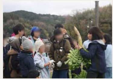
食農探究プログラム