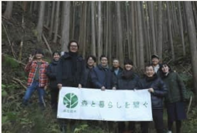
設計者への森林ツアー