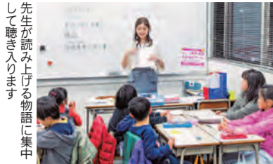
先生が読み上げる物語に集中して聴き入ります