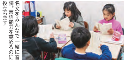
名文をみんなで一緒に音読。言語能力を高めるのに役立ちます

類塾では、「自分で考える力」を伸ばすためには、幼いころから「本当の頭の使い方」を習得することが大切と考えています。そこで、5歳〜小学3年生を対象に「新類型」のクラスが開講されています。茨木阪急教室で授業の様子を取材しました。