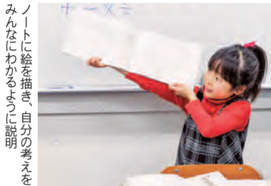
ノートに絵を描き、自分の考えをみんなにわかるように説明