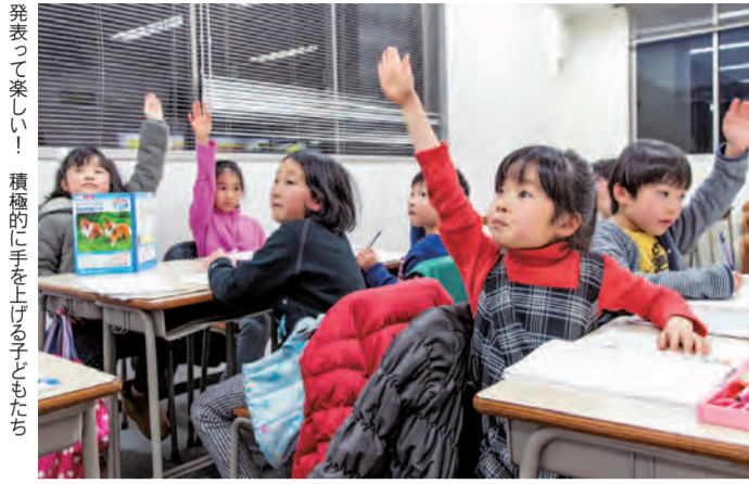
発表して楽しい！積極的に手を上げる子どもたち